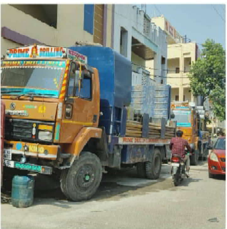
నిలిచిపోవడంతో కాలనీవాసులు హర్షం వ్యక్తం చేశారు. భవిష్యత్తులో కూడా ఇలాంటి అక్రమ కార్యకలాపాలపై అధికారులు కఠినంగా వ్యవహరించాలని వారు కోరారు. ఈ కార్యక్రమంలో స్థానిక డివిజన్ బి.ఆర్.ఎన్ పార్టీ అధ్యక్షుడు