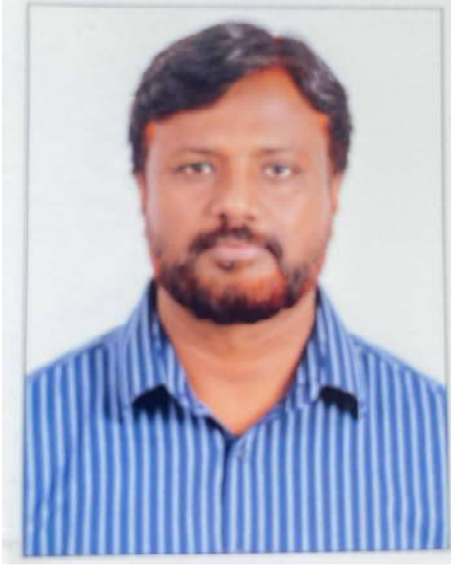
చర్యలు తీసుకుంటాం. భవిష్యత్ తరాలకు నీటి వనరులను కాపాడేందుకు ప్రతి ఒక్కరూ బాధ్యతాయుతంగా వ్యవహరించాలి” అని స్పష్టం చేశారు. స్థానికుల చొరవ, రెవెన్యూ శాఖ తక్షణ స్పందనతో అక్రమ బోరు తవ్వకాలు