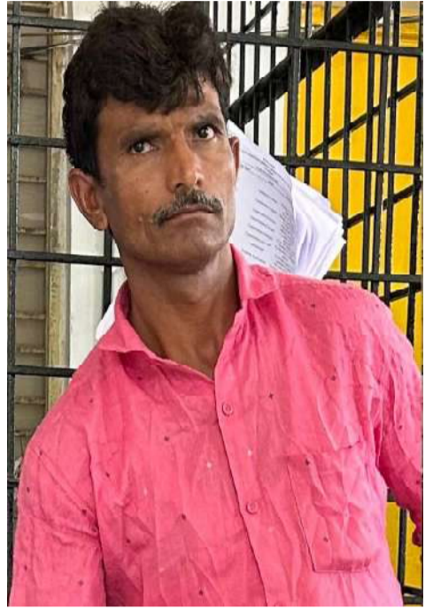
కుత్బుల్లాపూర్ వాస్తవ తెలంగాణ న్యూస్ ప్రతినిధి దుర్గారావు... ఏడేళ్ల బాలికపై లైంగిక దాడికి పాల్పడిన కేసులో తండ్రి కొడుకులకు కోర్టు