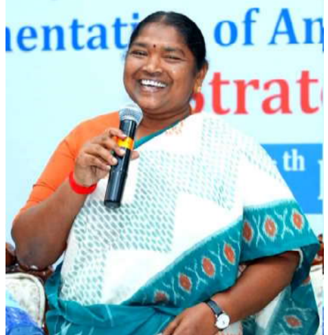
సాగుతోంది" అని మంత్రి తెలిపారు. దేశ జీడీపీలో

వడ్డీ లేని రుణాలను రూ. 5 లక్షల నుంచి రూ. 10 లక్షలకు పెంచాం. మహిళల అభివృద్ధి తెలంగాణ అభివృద్ధి అనే నమ్మకంతో ప్రభుత్వం ముందుకు