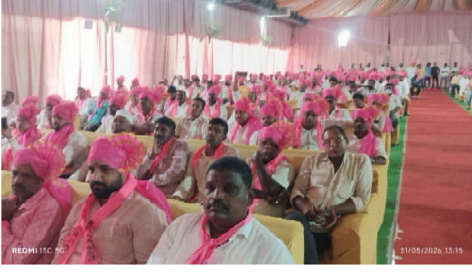
కర్తలు, అభిమానులు పెద్ద ఎత్తున పాల్గొన్నారు.

లక్ష్మారెడ్డి నాయకులు పిలుపునిచ్చారు. సభ్యత్వ రుసుములు: సాధారణ సభ్యత్వం -- రూ.10/- క్రియాశీలక సభ్యత్వం -- రూ.50/- ఈ సమావేశంలో పాల్గొన్న నాయకులు, కార్యకర్తలందరికీ ధన్యవాదాలు. రాబోయే రోజుల్లో బి ఆర్ ఎస్ పార్టీని మరింత బలపర్చేందుకు కార్యకర్తలందరూ ఐక్యంగా పనిచేయాలని నాయకులు సూచించారు. ఈ కార్యక్రమంలో బిఆర్ఎస్ పార్టీ ప్రజాప్రతినిధులు, మాజీ ప్రజాప్రతినిధులు, మున్సిపల్/ డివిజన్/వార్డు అధ్యక్షులు, సీనియర్ నాయకులు, మహిళా నాయకురాళ్ళు, యువజన విభాగం నాయకులు - సభ్యులు, పార్టీ వివిధ అనుబంధ సంఘాల నాయకులు - సభ్యులు, కార్య