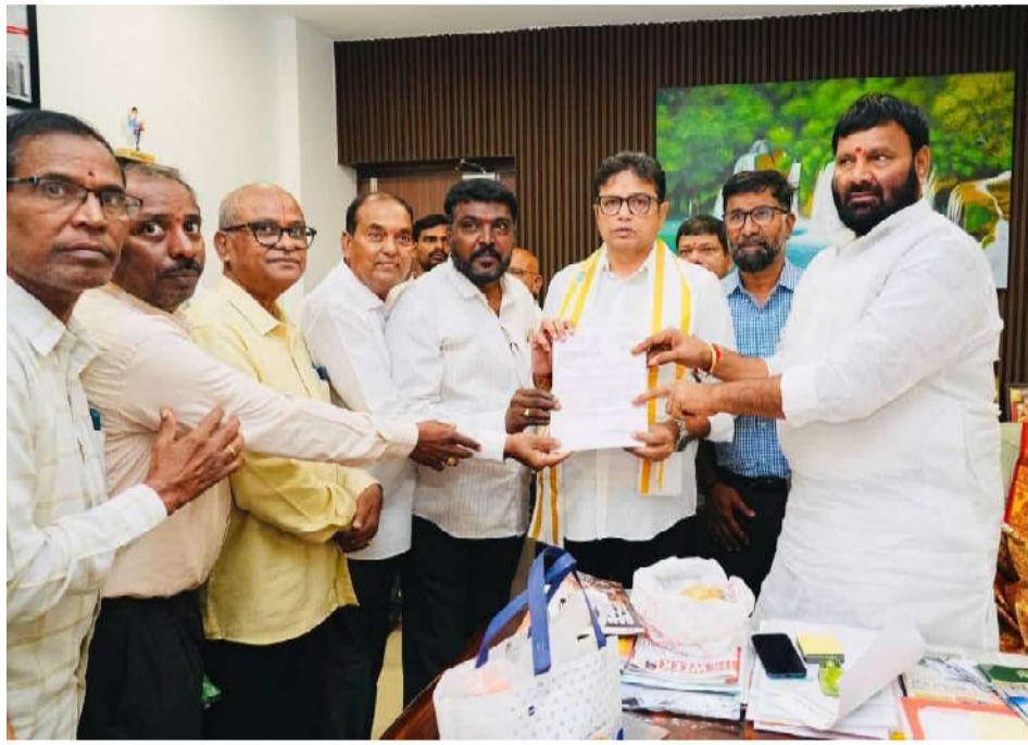
నిషేధిత జాబితా) చేర్చడం చేత సుమారు 150 స్థానిక కాంగ్రెస్ పార్టీ నాయకులు కార్యకర్తలు కుటుంబాలు ఇబ్బంది పడుతున్న ఈ సమస్యను పోల్చారు...

కుత్బుల్లాపూర్ వాస్తవ తెలంగాణ న్యూస్ ప్రతినిధి దుర్గారావు... కుత్బుల్లాపూర్ నియోజక వర్గం గాజులరామారం సర్కిల్లోని వల్లభాద్ పటేల్ నగర్ కాలనీవాసులు ఎదుర్కొంటున్న అక్రమ ఇళ్ల నిర్మాణాలు అంటూ మున్సిపల్ సిబ్బంది జారీ చేస్తున్న జరిమానాల గురించి శని వారం మాజీ ఎమ్మెల్యే శ్రీశైలం గౌడ్ ఆధ్వర్యంలో వారు ఎదుర్కొంటున్న ఈ సమస్యలను ఇన్చార్జి మంత్రి శ్రీధర్ బాబు దృష్టికి తీసుకెళ్లారు, వారు గత 30 సంవత్సరాల క్రితం నిర్మించుకున్న ఇళ్లకు అన్ని అనుమతులు ఉన్నప్పటికీ ఇవి అక్రమ ఇళ్ల నిర్మాణాలు అంటూ వారు మున్సిపల్ సిబ్బంది విధిస్తున్న జరిమానాలను తక్షణమే ఉపసంహరించి న్యాయం చేయాలని మంత్రి కి విన్నవించారు.. అనంతరం మంత్రి సైబరాబాద్ మున్సిపల్ కమిషనర్ సంజన తో మాట్లాడి ఈ సమస్యకు తక్షణమే పరిష్కారం చూపాలని కమిషనర్ ని కోరారు.. అదేవిధంగా కుత్బుల్లాపూర్ డివిజన్లోని ఎమ్.ఎన్.రెడ్డి నగర్ వాసులు ఎదుర్కొంటున్న ఇంటి రిజిస్ట్రేషన్లను మరియు వారి స్థలాలను ప్రొహిబిటెడ్ జాబితా (