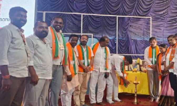
నారాయణఖేడ్ వాస్తవ తెలంగాణ న్యూస్ సంగారెడ్డి జిల్లా నారాయణఖేడ్ నియోజకవర్గం లో పండిట్ దిన్ దయాల్ ఉపాధ్యాయ ప్రశిక్షణ మహాభియాన్ 2026 మండల ప్రశిక్షణ శిబిరం నిర్వహించారు. సంగారెడ్డి జిల్లా నారాయణఖేడ్ నియోజకవర్గం మండల అభియాన్ ఏడు కాలం కాలం కుడిన ప్రశిక్షణ శిబిరం నిర్వహించడం జరిగింది