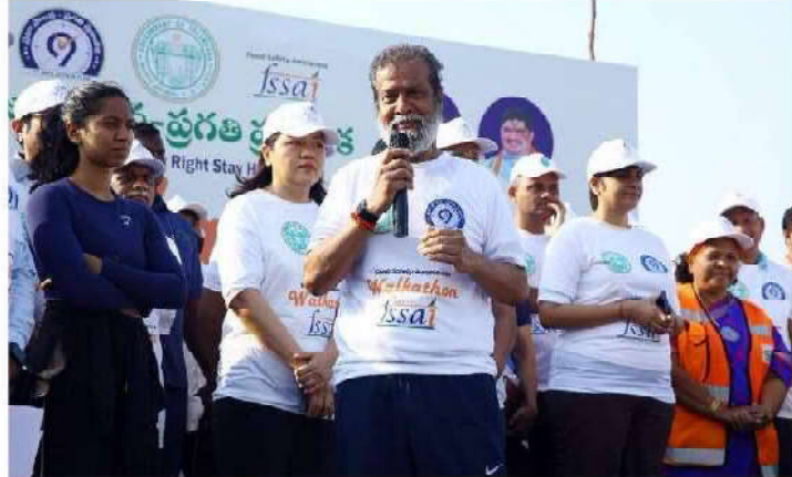
ఆహారపు అలవాట్లతోనే.. అనారోగ్యం

ఆర్థిక వ్యవస్థలో కీలక పాత్ర పోషిస్తూ పెద్దపట్టు ఉద్దేశ్యం, డిమాండ్ అవకాశాలు కల్పిస్తోంది. ఈ రంగం అభివృద్ధిని ప్రోత్సహిస్తూ, వాడ్యతతో చూడని వ్యక్తులను చూడాలి. ఫుడ్ సేఫ్టీ అనేది ప్రభుత్వ బాధ్యత మాత్రమే కాదు, ఆహార ఉత్పాదకులు, వ్యాపారులు, వినియోగదారులందరినీ ముప్పి బాధ్యత. "ఈటీ రైట్ - స్క్వేర్" అనే నందేశాన్ని అందరం ఆచరిద్దాం. కలిసికట్టుగా ఆరోగ్య తెలంగాణ నిర్మించుకుందాం" అని తెలియజేశారు.