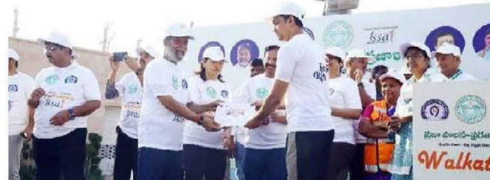
ఆహారపు అలవాట్లతోనే.. అనారోగ్యం