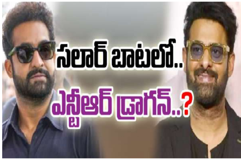
సలార్ బాటలో.. ఎన్టీఆర్ డ్రాగన్..?

2 కోసం అభిమానులే కాదు.. సామాన్య ప్రేక్షకులు కూడా ఆతృతగా ఎదురు చూస్తున్నారు. ఇటీవల