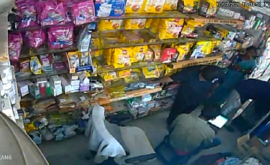
కుత్బుల్లాపూర్ వాస్తవ తెలంగాణ న్యూస్ ప్రతినిధి