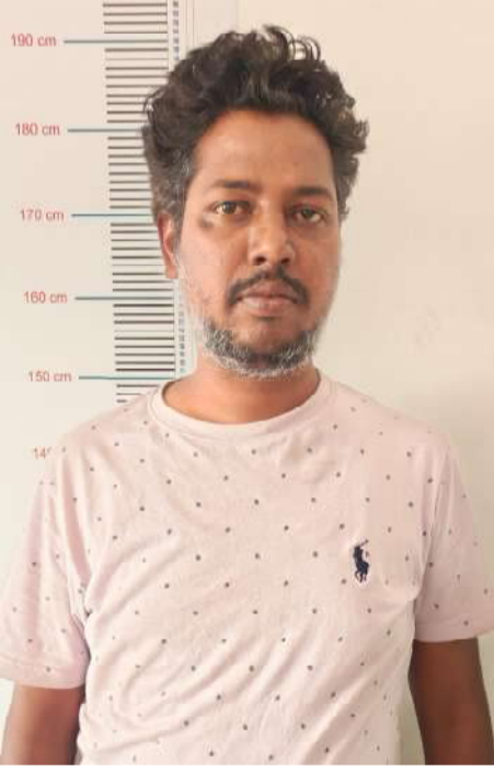
నకిలీ ఆఫర్ లెటర్లతో మోసం

ఈ విధంగా బాధితుల నుంచి సేకరించిన మొత్తంగా 47 లక్షల 20 వేల రూపాయలను నిందితుల ఖాతాలకు బదిలీ చేసినట్లు దర్యాప్తులో బయటపడింది. మొత్తం 137 మంది నిరుద్యోగులను ఈ మూతా మోసం చేసినట్లు పోలీసులు గుర్తించారు.