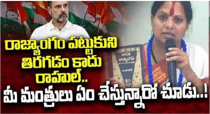
రాజ్యాంగం పట్టుకుని తిరగడం కాదు రాహుల్.. మీ మంత్రులు ఏం చేస్తున్నారు చూడు..!