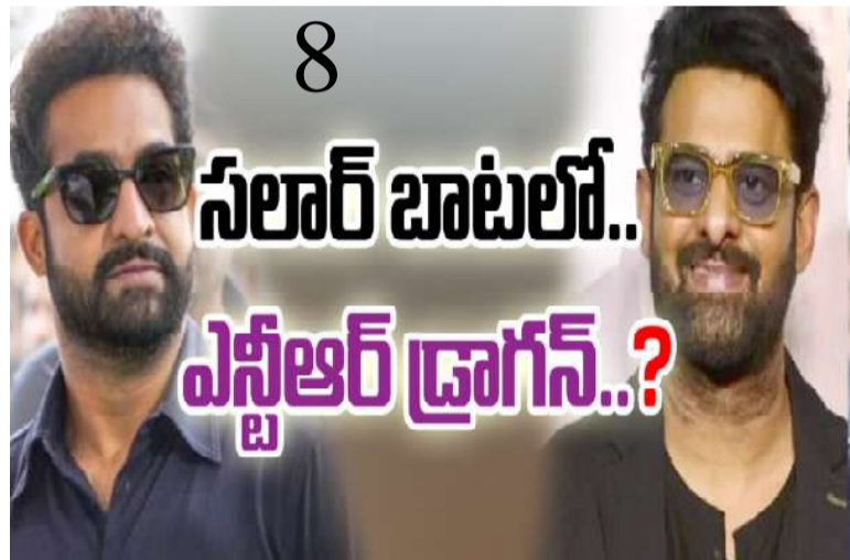
8 నెలార్ బాటల్డ్.. ఎన్టీఆర్ డ్రాగన్..?