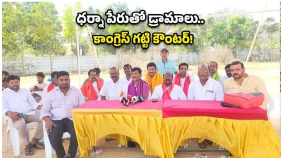
ధర్మాపీఠాల్లో డ్రామాలు.. కాంగ్రెస్ గట్టి కౌంటర్!

మేడ్చల్ నియోజకవర్గంలో తాగునీటి సమస్యపై రాజకీయం వేడెక్కింది. బీఆర్ఎస్ నాయకుల ధర్మాపై కాంగ్రెస్ నాయకులు తీవ్రంగా స్పందించారు.