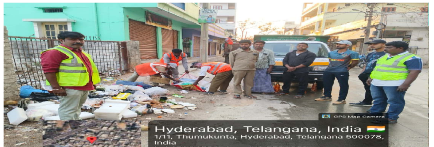
కీసర మండలం వాస్తవ తెలంగాణ న్యూస్/మేడ్చల్ జిల్లా కీసర సర్కిల్-01 పరిధిలోని ప్రజా పాలనా - ప్రగతి ప్రణాళిక 99 రోజుల కార్యక్రమములో భాగముగా 3వ రోజు (08/03/2026) సర్కిల్ పరిధిలోని సాయి శ్రీ రెసిడెన్సీ, దమ్మాయిగూడ, ఉప్పర్ పల్లి జిల్లా పరిషత్ ప్రాథమికస్థానా పాఠశాలవద్ద, నందమూరి నగర్, జవహర్ నగర్, జ్యోతి రావు కాలనీ , అంబేత్కర్ నగర్, శివ శివాని కాలనీ ఫేస్ - XX, దేవరయంజాల్, షామీర్ పేట్ డివిజన్, ఎస్ వి ఎస్ హాస్పిటల్ రోడ్డు, తూకుంట మరయు ఇతర ప్రదేశములలో స్వస్థ సత్వం ఆవేశం నిర్వహించుట జరిగినది అని సర్కిల్ అధికారులు ఒక ప్రకటనలో తెలిపారు.