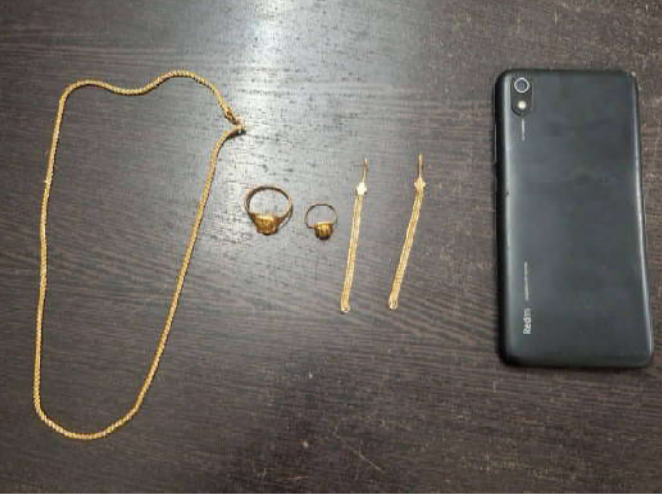
తగిన భద్రతా చర్యలు తీసుకోవాలని కీసర పోలీసులు సూచిస్తున్నారు.