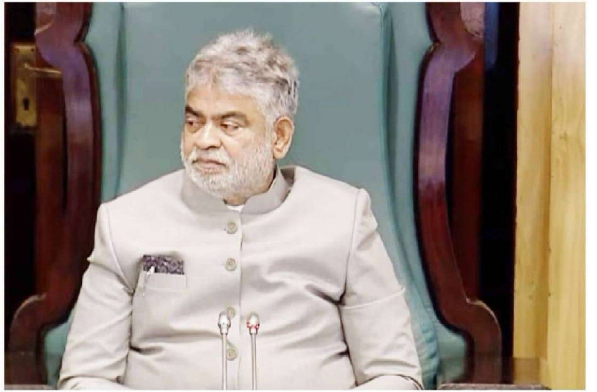
వాస్తవ తెలంగాణ :