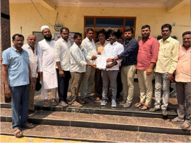
కురుమ సంఘం సభ్యులు ఆక్రమణలను తొలగించాలని డిమాండ్ చేశారు.