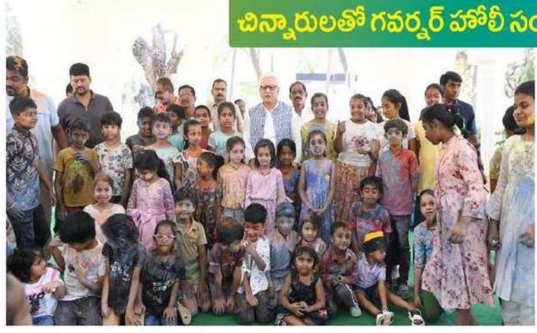
చిన్నారులతో గవర్నర్ హాజీ సందడి

ఇద్దరు పిల్లలను చంపి తల్లి అక్కడకు గొల్లగొడిం గ్రామంలో వివేకపూర్వక