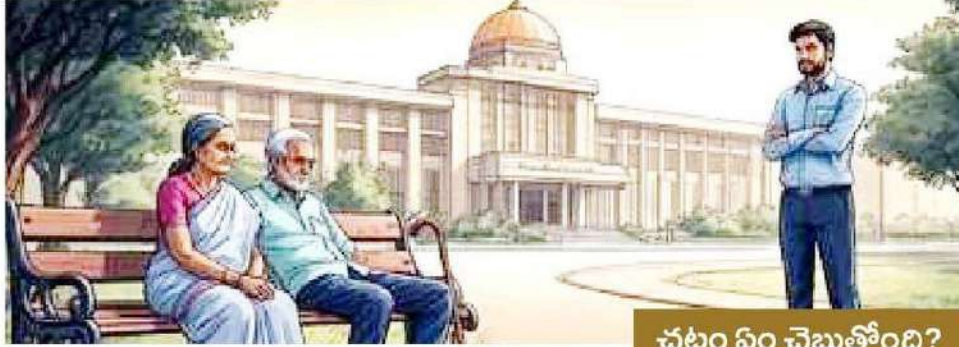
చట్టం ఏం చెబుతోంది?

హైదరాబాద్, వాస్తవ తెలంగాణ నయా రూల్ తీసుకొస్తున్న సర్కారు