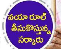
నయా రూల్ తీసుకొస్తున్న సర్కారు

వృద్ధాప్య పేరేంట్స్ కోసం కొత్త చట్టం విల్లలజీతాల్లో కోతకు చర్యలు నేరుగా తల్లిదండ్రుల ఖాతాల్లో జమ చేయాలని రూపకల్పన చేస్తున్న ప్రభుత్వం