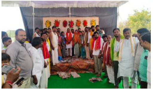
మేధల్ వాస్తవ తెలంగాణ.

ఎల్లంపేట్ మున్సిపల్ పరిషత్ లోని సోమారం లో గల శ్రీ పెద్దమ్మ తల్లి కళ్యాణం కన్నుల పండువగా జరిగింది. శ్రీ పెద్దమ్మ తల్లి ఆలయ మొదటి వార్షికోత్సవం సందర్భంగా అమ్మవారి కళ్యాణం, హోమం, టోనాల సమర్పణ, అన్నదాన కార్యక్రమం పంటి పూజా కార్యక్రమాలు నిర్వహించారు. ఆలయంలో నిర్వహించిన పెద్దమ్మతల్లి కళ్యాణం