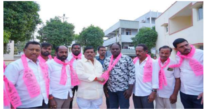
పటాన్వయం, వాస్తవ తెలంగాణ న్యూస్:

- పార్టీ కందువా కష్టి ఆహ్వానించిన ఎమ్మెల్యే జిఎంఆర్