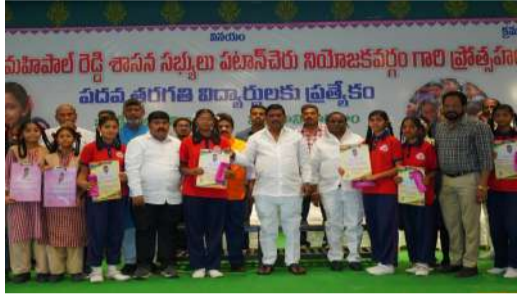
పటాన్వయం, వాస్తవ తెలంగాణ న్యూస్: