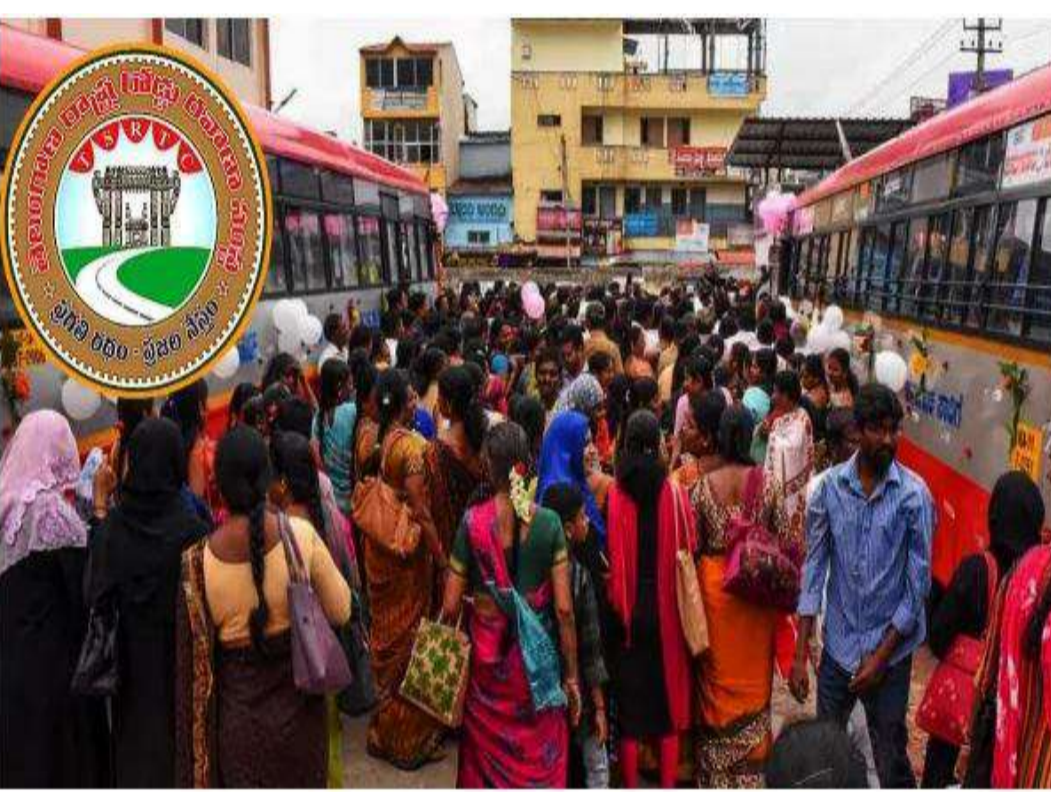
ఉంటుంది. వెనక భాగంలో ఉచిత బస్సు పథకానికి సంబంధించిన నియమ నిబంధనలు పొందుపరిచారు. రాష్ట్రవ్యాప్తంగా సుమారు 1.5 కోట్ల మందికి ఈ స్మార్ట్ కార్డులు జారీ అవుతున్నాయి. ఇందుకోసం సెంటర్ ఫర్ గుడ్ గవర్నెన్స్ తో కీలక ఒప్పందం చేసుకుంది. ఈ సంస్థ సహకారంతో ప్రతి మహిళకు ప్రత్యేక కార్డులు పంపిణీ చేయనున్నారు. ప్రభుత్వం తీసుకొచ్చే ఈ స్మార్ట్ కార్డు చూపించి మహిళలు ఇకపై ఆర్కెస్ బస్సుల్లో ప్రయాణం చేసే విధంగా నిర్ణయం తీసుకున్నారు. ప్రస్తుతం బెంగళూరు, ముంబయి, లక్నో నగరాల్లోని బస్సుల్లో స్మార్ట్ కార్డు విధానాల్లో ఎలాంటి ఫీచర్లు చేస్తున్నారు.