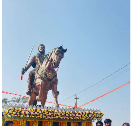
చౌటకూర్/వాస్తవ తెలంగాణ న్యూస్ కృష్ణ కాంత్ ప్రతినిధి ఫిబ్రవరి 19 చక్రవర్తి శివాజీ చేసిన పోరాటాలను స్ఫూర్తిగా తీసుకొని యువత