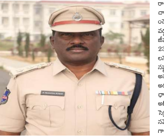
ఆమెను కులం పేరుతో దూషిస్తూ బాతు మాటలు మాట్లాడినట్లు ఫిర్యాదు అందినట్లు తెలిపారు. ఈ ఘటన విషయమై బాధితు