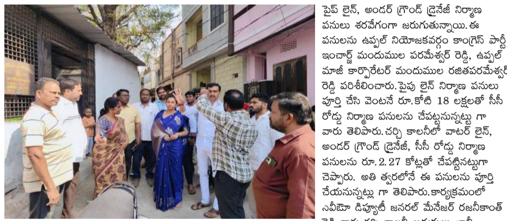
ఉప్పల్ వాస్తవ తెలంగాణ న్యూస్/

మేడ్చల్ జిల్లా ఉప్పల్ డివిజన్ పరిధిలోని చర్చి కాలనీలో అభివృద్ధి పనులు వేగంగా సాగుతున్నాయి. కాలనీలో కలుషిత మంచినీటి సమస్య పరిష్కారానికి రూ.కోటి 9 లక్షలతో వాటర్