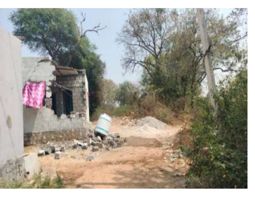
కామ్రే మండలం వాస్తవ తెలంగాణ న్యూస్/ ప్రభుత్వ భూముల అక్రమణదారుల గుండెల్లో రెవెన్యూ అధికారులు రైళ్లు పరిగెత్తించారు. మేడ్చల్ జిల్లా కామ్రే మండలం జవహర్ నగర్ పరిధిలో అక్రమంగా వెలుస్తున్న నిర్మాణాలపై