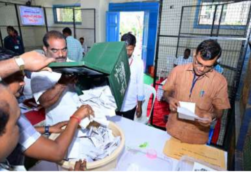
వాస్తవ తెలంగాణ న్యూస్ మెడక్ ప్రతినిధి(ఆంజనేయులు)