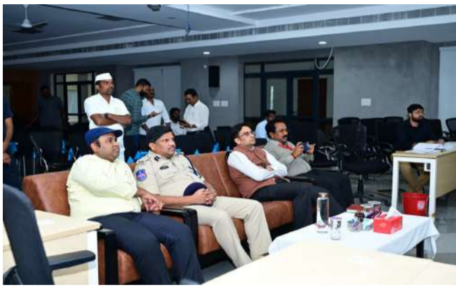
మెడక్ జిల్లాలో నాలుగు మున్సిపాలిటీ పరిధిలో మున్సిపల్