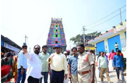
ప్రశాంతంగా ముగించాలన్నారు. అన్ని శాఖల సమన్వయంతో