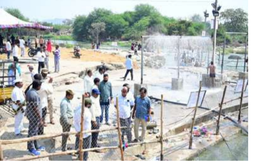
పనిచేయాలన్నారు. ఈ కార్యక్రమంలో అలయ చోవ్ వీరశం, వివిధ శాఖల అధికారులు, తదితరులు పాల్గొన్నారు