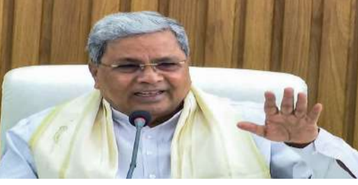
అప్పట్లో సామాజిక న్యాయ పోరాటానికి మరో బంపర్ రికార్డ్ సిద్ధం - రామయ్య తొలిసారిగా 2013 మే 13న

కరాటక : కరాటక ముఖ్యమంత్రి సిద్ధరామయ్య సరికొత్త రికార్డును సొంతం చేసుకున్నారు. సుబీరకాలం పాటు రాష్ట్ర సీఎంగా సేవలు అందించిన నేతగా చరిత్ర సృష్టించారు. అది కూడా ఈ ఏడాది సూతన సంవత్సర వేడుకల రోజున (జనవరి 1న) ఈ రికార్డును క్రియేట్ చేశారు. ఇంతకుముందు ఈ రికార్డు మాజీ సీఎం దేవరాజ్ ఉర్ఫి పేరిట ఉండేది. 2026 జనవరి 2 నాటికి సీఎం హెూడాలో 2,791 రోజుల పదవీ కాలాన్ని సిద్ధరామయ్య పూర్తి చేసుకున్నారు. పేర్కొంటూ కరాటక ప్రభుత్వం అధికారిక గెజిట్ నోటిఫికేషన్ సువిధుల చేసింది. మాజీ సీఎం దేవరాజ్ ఉర్ఫి 2,789 రోజులు అంటే ఏడు సంవత్సరాల 6 నెలల పాటు సీఎంగా సేవలు అందించారు.