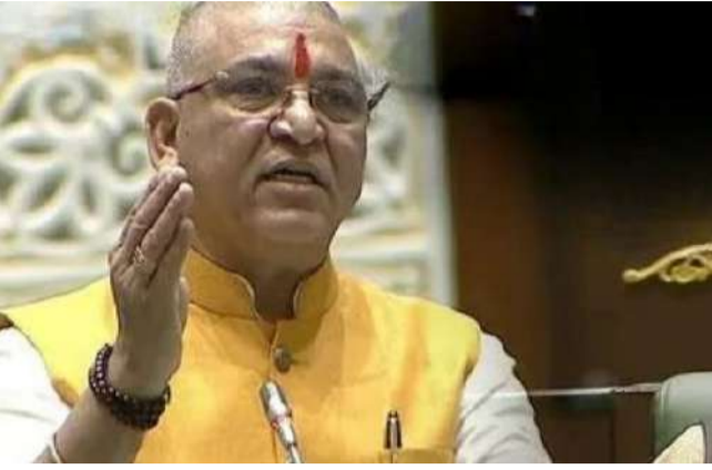
బాబు కోరారు. నిధుల విడుదలలో ఎలాంటి ఇబ్బంది లేదని... ముఖ్యమంత్రి, సంబంధిత మంత్రిని కలిసినా ఫైట్లు కడలడం లేదని ఆవేదన వ్యక్తం చేశారు. ఈ ప్రాజెక్టు పూర్తియితే రెండు మంది అనేక సాగునీరు అందుతుందన్నారు. రైతులకు భార

హైదరాబాద్, జనవరి 03 : తెలంగాణ అసెంబ్లీ సమావేశాలు మూడో రోజు కొనసాగుతున్నాయి. సభ మొదలైన వెంటనే స్పీకర్ గడ్డం ప్రసాద్ కుమార్ ప్రశ్నోత్తరాలను చేపట్టారు. ప్రశ్నోత్తరాల్లో భాగంగా బీజేపీ ఎమ్మెల్యేలు తమ నియోజకవర్గాల్లో సమస్యలను సభ దృష్టికి తీసుకొచ్చారు. ముఖ్యంగా నీటిపారుదల ప్రాజెక్టులు, నిర్మాణ రైతులకు పరిహారం, సాగునీటి సౌకర్యాలపై ప్రభుత్వాన్ని నిలదీశారు బీజేపీ ఎమ్మెల్యేలు. చనాక కోరాల ప్రాజెక్ట్ నిర్మాణ రైతుల సమస్యలను ఆదిలాబాద్ ఎమ్మెల్యే పాయల్ శంకర్ సభలో లేవనెత్తారు. చనాక కోరాల ప్రాజెక్ట్ నిర్మాణ రైతులకు న్యాయం చేయాలని డిమాండ్ చేశారు. కోట్లాది రూపాయల విలువ చేసే భూములకు లక్షల రూపాయలే పరిహారం ఇస్తామన్నారు గుర్తుచేశారు. పదేళ్లు అయ్యిందన్నారు. నీళ్లు రాలేదని.. పరిహారం రాలేదని ఆదిలాబాద్ రైతులు పాద యాత్రగా హైదరాబాద్ కు వచ్చారని తెలిపారు. ప్రభుత్వం నిధులు విడుదల చేసి వెంటనే భూనిర్మాణాలకు పరిహారం ఇవ్వాలని ప్రభుత్వానికి ఎమ్మెల్యే పాయల్ శంకర్ డిమాండ్ చేశారు. జైనాథ్ ప్రాజెక్టుపై నిర్మాణ ఎమ్మెల్యే జైనాథ్ ప్రాజెక్టును వెంటనే పూర్తి చేయాలని సిద్దార్ ఎమ్మెల్యే పాల్గొన్నారు హరిష్.