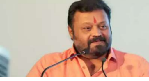
లి లేదా రాష్ట్రంలో ప్రభావశీల రాజకీయ శక్తిగా ఎదగాలి. అలా జరిగితేనే రాష్ట్ర వికాసం సాధ్యమవుతుంది. మచ్చుకు చూస్తే, కేంద్ర ఫోర్స్ లోని లోకసభలోని తొలుత నేను ప్రాతినిధ్యం వహిస్తున్న త్రిసూర్ కు కేటాయింబాలని ప్రతిపాదించారు. త్రిసూర్ లో ఈ తేజోవీరర్ ఏర్పాటుకు 25 వందల స్థలాన్ని కేటాయించమని రాష్ట్ర సర్కారును కేంద్ర ప్రభుత్వం కోరింది. కానీ రాష్ట్ర సర్కారు త్రిసూర్ లో సరిపడా స్థలం లేదని కేంద్రానికి చెప్పింది. ఎందుకంటే త్రిసూర్ లోనే నేను బీజేపీ ఎంపీగా ఉన్నాను. అందుకే ప్రతిపాదన ఫోర్స్ లోని త్రిసూర్ నుంచి

కేరళ : కేరళ అభివృద్ధి చెందాలంటే, బీజేపీ సార్థుల్లో డబుల్ ఇంజీన్ సర్కారు ఏర్పాటు ఉంటుందని కేంద్రమంత్రి, త్రిసూర్ ఎంపీ సురేష్ గోపి అన్నారు. డబుల్ ఇంజీన్ ప్రభుత్వాలతో బీజేపీ పాలిత రాష్ట్రాలు పొందుతున్న ప్రయోజనాలను గురించి ఒకసారి తెలుసుకోవాలని కేరళ ప్రజలకు ఆయన పిలుపునిచ్చారు. కేరళలోని కొల్లంలో ఆయన ఈ కామెంట్స్ చేశారు. అయితే డబుల్ ఇంజీన్ ప్రభుత్వం లేకపోయినా తమిళనాడు రాష్ట్రం అభివృద్ధిలో దూసుకుపోతోందని సురేష్ గోపి కొనియాడారు. కేంద్రంలో ప్రత్యర్థి పార్టీలు అధికారంలో ఉన్నా, రాష్ట్ర ప్రజలకు అవసరమైనప్పటికీ తమిళనాడు సర్కారు సాధించుకుంటోందని ఆయన వ్యాఖ్యానించారు. కొల్లం లోక్ సభ ఎంపీ, రెవల్యూషనరీ సోషలిస్ట్ పార్టీ నేత ఎన్కే ప్రేమ్ చంద్రన్ తన కలిసి కొల్లం రైల్వే జంక్షన్ ను కేంద్రమంత్రి సందర్శించారు. రైల్వే జంక్షన్ లోని ప్రాచీన భవనాలను వారసత్వ కట్టడాలుగా పరిరక్షించేందుకు ఉన్న సాధ్యసాధ్యాల గురించి అధికారులను అడిగి సురేష్ గోపి తెలుసుకున్నారు. ఫోర్స్ లోని కేరళ సర్కారు స్థలమిప్ప లేదా "కేరళ అభివృద్ధి కోసం బీజేపీ తప్పకుండా బలోపేతం చేశావాలి. అది సొంతంగా రాష్ట్రంలో ప్రభుత్వాన్ని ఏర్పాటు చేయ