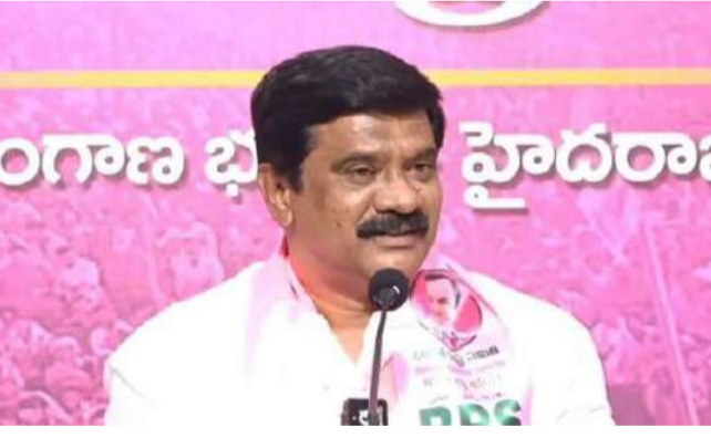
అసెంబ్లీకి రావాలా అంటూ నిలదీశారు. అందుకే అసెంబ్లీని వెల్లడించారు