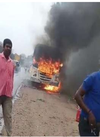
మేడ్చల్ వాస్తవ తెలంగాణ మేడ్చల్ నేషనల్ హైవే 44 పై మేడ్చల్ పోలీస్ స్టేషన్ పరిధిలో ప్రైవేటు బస్సులో మంటలు చెలరేగి, పూర్తిగా దగ్ధమైంది. ఈ ఫుటన గురువారం ఉదయం జరిగింది. స్టాఫ్ కులలు తెలిపిన వివరాలు ప్రకారం మేడ్చల్ మండలంలోని బండ మైలారం నుండి కొంచెలికి వెళ్తుండగా మేడ్చల్ ఐటిఐ వద్దకు రాగానే ఓ ప్రైవేట్ బస్సు లో మంటలు ఒకసారిగా చెలరేగాయి.దీంతో డ్రైవర్ అప్రమత్తమై బస్సును పక్కకు ఆపాడు. క్షణాల్లో బస్సు మొత్తం పూర్తిగా దగ్ధమైంది. బస్సులో ఎవరు లేకపోవడంతో పెను ప్రమాదం తప్పింది. షార్ సర్కూల్స్ ద్వారానే బస్సు దగ్ధమైందని డ్రైవర్ తెలిపారు. సంఘటనా స్థలానికి ఫైర్స్ ఇంజన్ నీ చేరుకొని మంటలను అదుపులోకి తెచ్చారు. ఫుటన స్థలానికి మేడ్చల్ పోలీసులు చేరుకొని పూర్తి వివరాలను సేకరిస్తున్నారు.