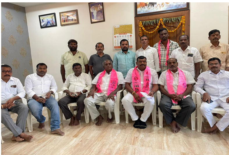
కులగణన పేరుతో ప్రజలను ఇబ్బందులకు గురి చేస్తూ పొంతన లేని ప్రశ్నలను తయారు చేశారని అన్నారు.